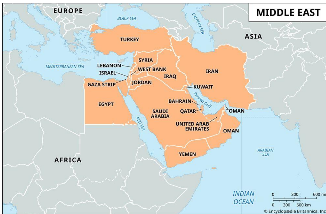
Abbildung 1: Karte des Nahen Ostens mit den Ländern, die am häufigsten als definierend für den Nahen Osten gelten, darunter die Arabische Halbinsel, die Levante, der Irak, der Iran, die Türkei und Ägypten.

Die Frage, was genau unter dem Nahen Osten zu verstehen ist, lässt sich nicht eindeutig beantworten. Üblicherweise bezeichnet der Begriff die westasiatische Region, in der Europa, Asien und Afrika geographisch sowie kulturell miteinander verschmelzen. Diese Gegend ist überwiegend muslimisch geprägt, beherbergt aber ebenso zahlreiche Angehörige jüdischer, christlicher und weiterer kleinerer Religionsgemeinschaften. Besonders hervorzuheben ist, dass der Nahe Osten als Wiege der monotheistischen Religionen – Judentum, Christentum und Islam – gilt. Viele Geschichten aus der Thora, der christlichen Bibel und dem Koran haben hier ihren Ursprung, weshalb die Region oft auch als Heiliges Land bezeichnet wird.