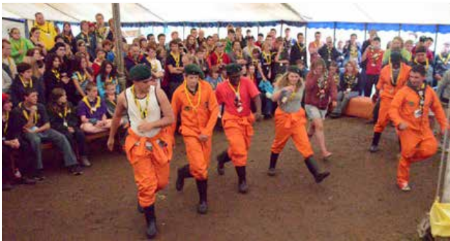
Beispielfoto „Dancings Scouts“ aus dem Internet.

„Hallo, wir sind eine Scout Gruppe aus Italien und wir sind 16/17 Jahre alt. Wir möchten wissen, wenn ihr Informationen über euren typischen Scout Tanzen zu geben, weil wir machen eine Suche um mehr über die Traditionen von andere Ländern zu erfahren. Wenn du willst, wir werden ein Video mit unseren typischen Tanzen im Anhang senden. Danke schön!!“